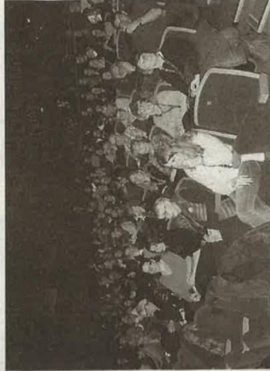
Le public lors du premier spectacle.