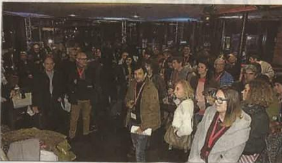
Le soir du lancement à La Baleine.

A 9 h 30, Si la neige était rouge (jeune public) à La Baleine. 11 heures, Lièvre (jeune public) à la MJC de Rodez. 14 h 30, Ravié (jeune public) à La Baleine.