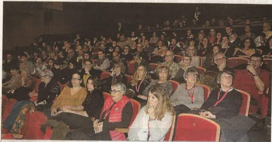
Le public était nombreux lors du premier spectacle.

P our soutenir la création régionale et favoriser sa diffusion, les réseaux Pyramid & Mixage, la MJC de Rodez, le club et La Baleine ont permis à près de 70 artistes, soit 14 compagnies d'Occitanie et de la Nouvelle Aquitaine de se produire sur scène, faisant ainsi découvrir leurs créations à un large public. Trois jours durant les propositions éclectiques se seront succédé, entre théâtre, musique et danse. Des artistes émergents soutenus et accompagnés par les différents réseaux auront également pu présenter leurs projets de création. En lançant l'édition 2018, mercredi soir à La Baleine et en présence de nombreuses person-